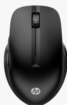
Souris sans fil multi-périphériques HP 430 3B4Q2AA