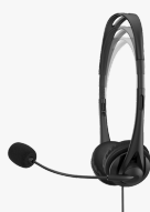
Casque stéréo HP 3,5mm G2 428H6AA