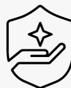
3 ans, enlèvement et retour U4812E