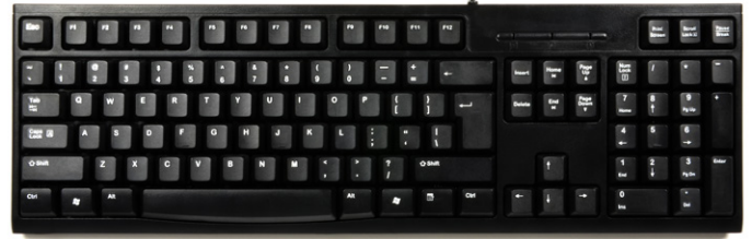
104 keys with USB connexion 104 touches avec connexion USB