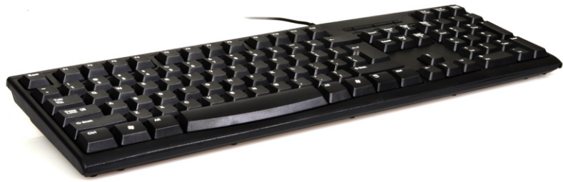
Office usb keyboard Clavier usb de bureau