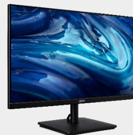
24" ZeroFrame FHD Monitor VA2 series