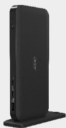
Acer USB Type-C Dock III