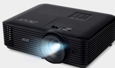
4,500 Lumens SVGA Projector X1128HK